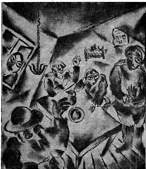
בנים גאליציאנער ייד